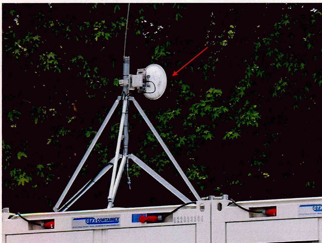
Widok instalacji radiokomunikacyjnej Stacja Netia DOBWB008 - DOBWM00001ANT001 Dobiegniew, ul. Leśna 2, nr działki 141/11 obręb Dobiegniew.