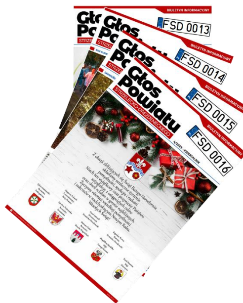
Okladki gazety „Głos Powiatu” na rok 2023

Wydanie Gazety wraz obsługą redakcyjną finansowaną ze środków promocyjnych powiatu. W ramach porozumienia pomiędzy gminami Dobiegniew i Stare Kurowo koszty wydania kwartalnika w części współfinansowane są przez partnerów porozumienia. Zawarte informacje dotyczą życia mieszkańców, aspektów gospodarczych, społecznych współpracujących z powiatem gmin. Zadania realizowane w sposób ciągły.