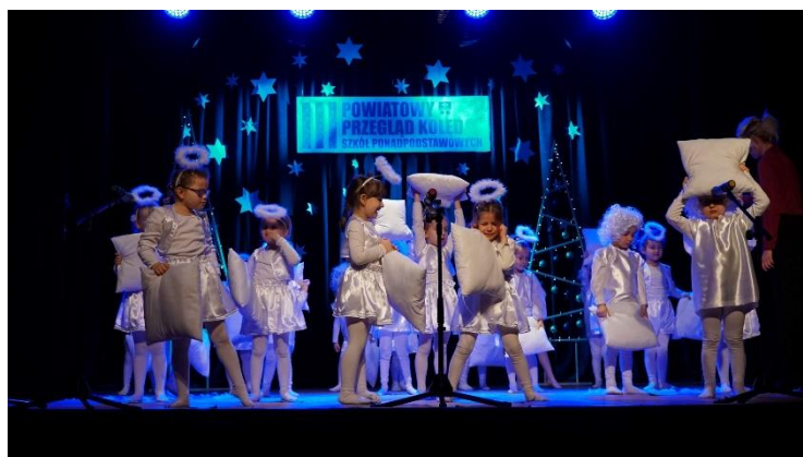
Zdjęcie z III Powiatowego Przeglądu Kolęd i Pastorałek