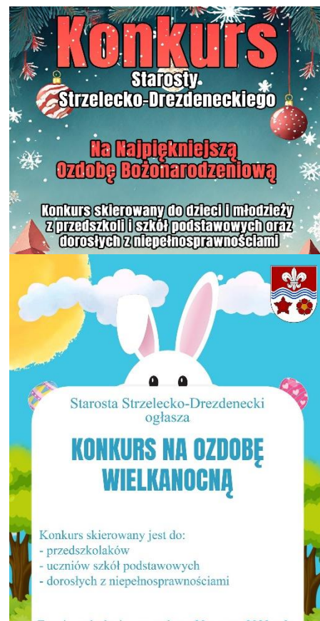
Plakaty związane z konkursami na ozdoby świąteczne