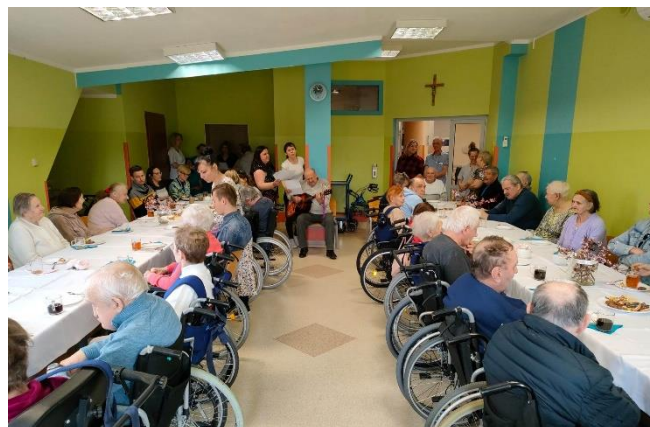
Zdjęcie ze spotkania w Domu Pomocy Społecznej

uczestniczyli w bardzo ciekawych warsztatach artystycznych, zdrowotnych oraz rehabilitacyjno-ruchowych. Na koniec przy wspólnym grillu była okazja do ciepłych rozmów i integracji z pensjonariuszami.