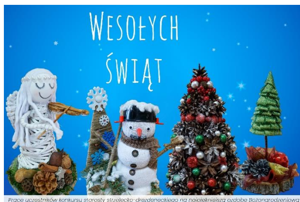
Projekt kartki bożonarodzeniowej