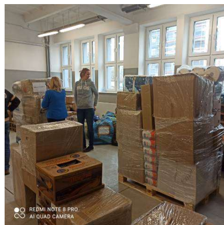
Powiatowy magazyn pomocy humanitarnej

Do najważniejszych zadań realizowanych w powiecie w roku 2022 zaliczyć należy: