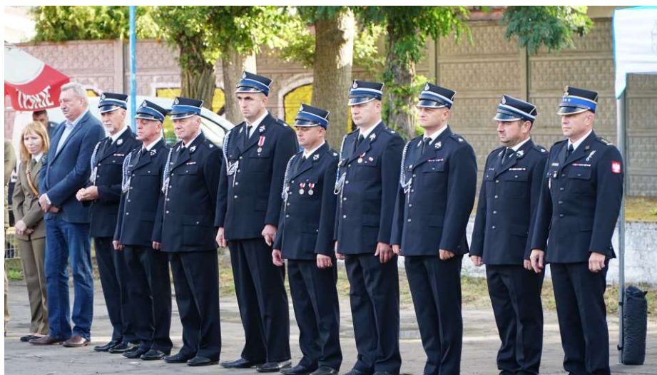
ZOP ZOŚP RP w Strzelcach Krajeńskich na powiatowych zawodach Młodzieżowych