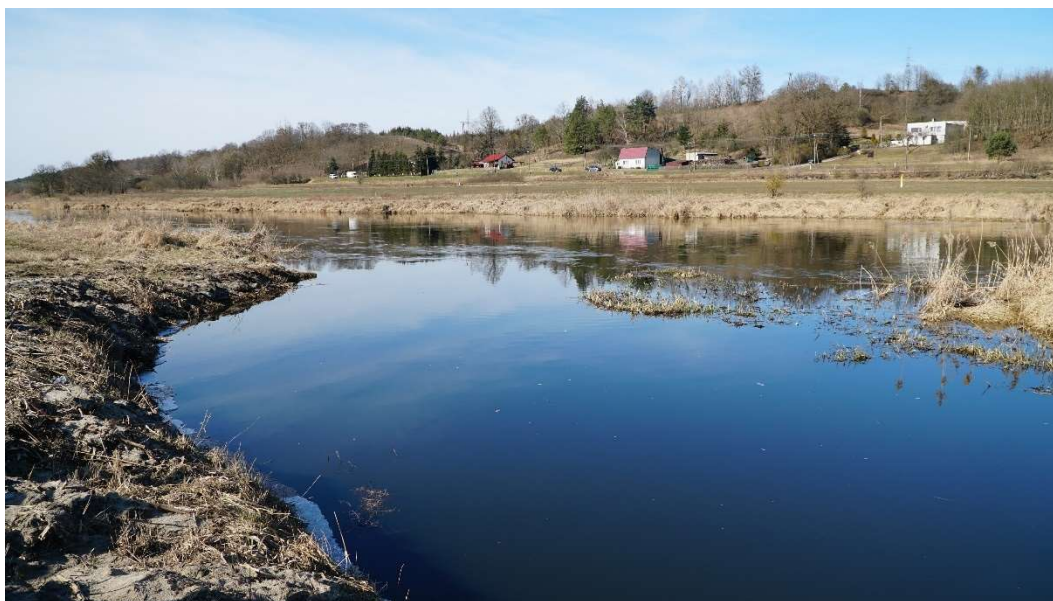
Objazd wałów przeciwpowodziowych