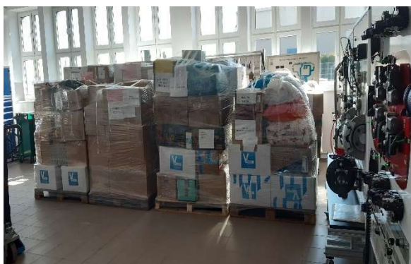
Powiatowy magazyn pomocy humanitarnej