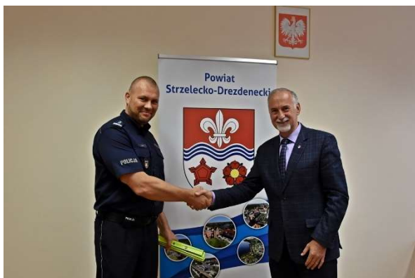
Dofinansowanie do gadżetów odblaskowych na realizację programu „Bezpieczny senior”