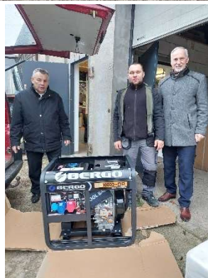
Zakupy inwestycyjne na zarządzanie kryzysowe