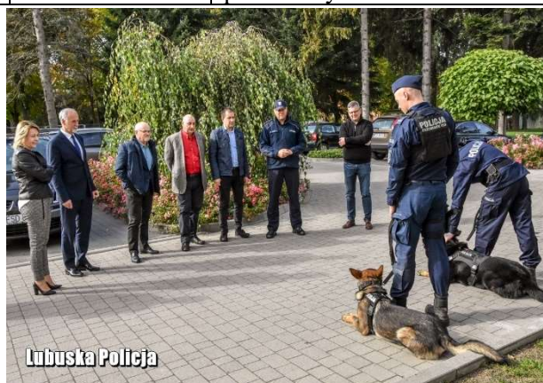
Dofinansowanie do psa służbowego dla KPP w Strzelcach Kraj.