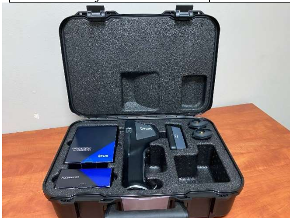
Dofinansowanie do kamery termowizyjnej wraz z osprzętem