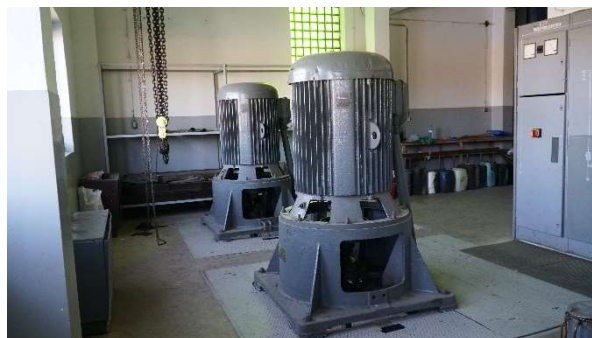
Przepompownia w m. Górecko