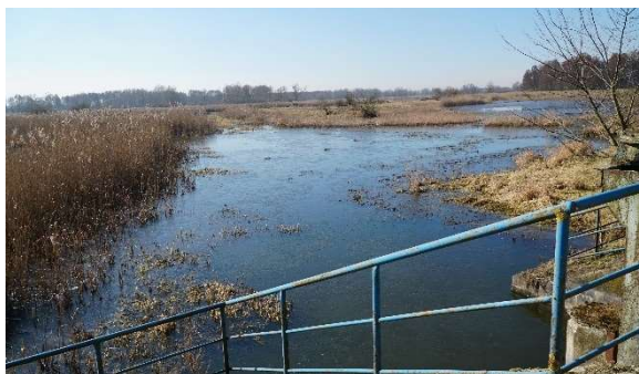
Objazd wałów przeciwpowodziowych

W ramach ochrony przeciwpowodziowej działa Powiatowy Magazyn Przeciwpowodziowy mający na wyposażeniu sprzęt i narzędzia do walki z powodzią oraz innymi nadzwyczajnymi zagrażającymi środowisku oraz życiu i zdrowiu. W 2022 r. zakupiono 2000 szt. worków przeciwpowodziowych, które w przypadku wystąpienia sytuacji kryzysowych będą wykorzystane przez służby.