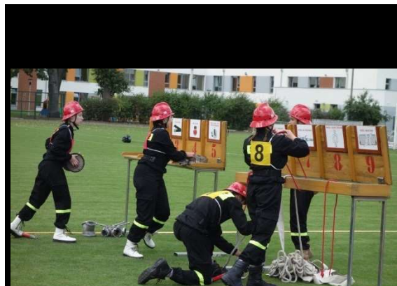
Powiatowe zawody sportowo-pożarnicze Młodzieżowych Drużyn Pożarniczych w Drezdenku