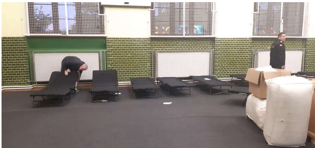
Doraźne miejsce zakwaterowania dla 50 osób